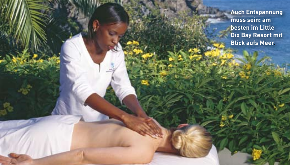
Auch Entspannung muss sein: am besten im Little Dix Bay Resort mit Blick aufs Meer.