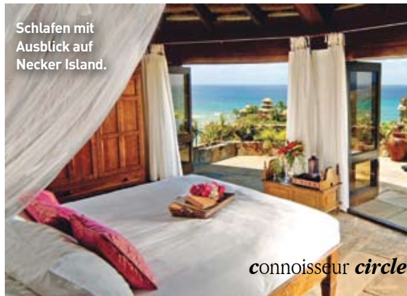
Schlafen mit Ausblick auf Necker Island.

Generell herrscht auf den Inseln eine ruhige und entspannte Atmosphäre. Genuss wird hier groß geschrieben und somit ist es nicht weiter verwunderlich, dass auch sehr großer Wert auf eine abwechslungsreiche und gehobene Küche gelegt wird. Denn bei einem tollen Essen auf einer romantischen Meerterrasse lassen sich die einzigartigen Sonnenuntergänge besonders gut genießen.