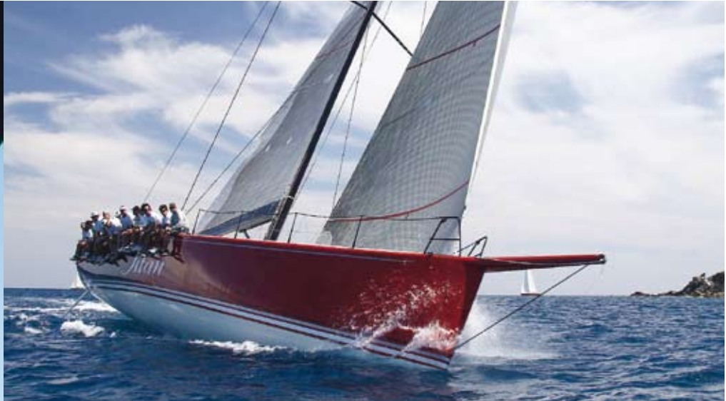
Kurs auf eine der vielen Trauminseln der BVI: Ganz neu ist das 5-Sterne-Luxus-Resort auf Scrub Island.