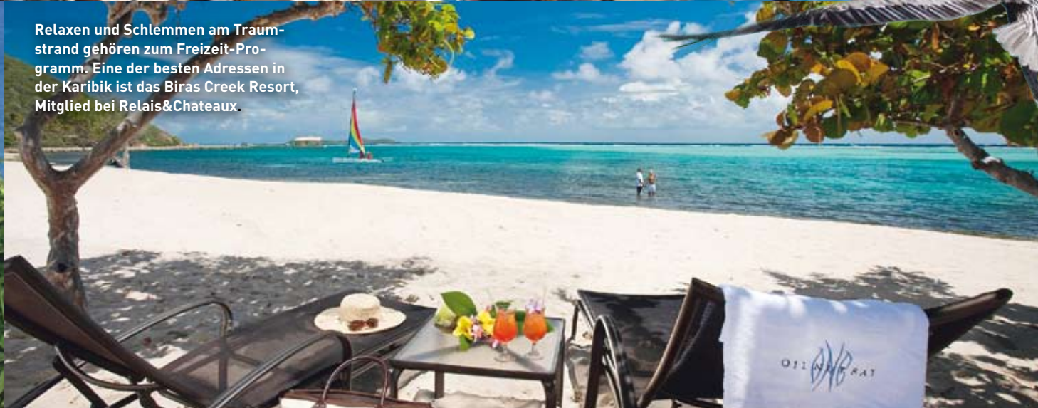
Relaxen und Schlemmen am Traumstrand gehören zum Freizeit-Programm. Eine der besten Adressen in der Karibik ist das Biras Creek Resort, Mitglied bei Relais&Chateaux.